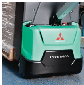
Водонепроницаемое и пылезащищенное шасси