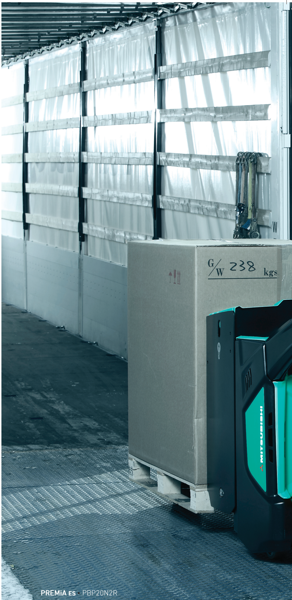
PREMIA ES · PBP20N2R

Операторы любят PREMIA, и вы тоже полюбите.