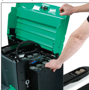
Универсальный аккумуляторный отсек с бесшарнирной крышкой

Разработанные для непрерывной работы в самых сложных условиях, PREMIA ES – сопровождаемые перевозчики паллет, которые помогут вам преодолеть расстояние.