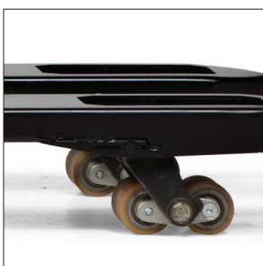
Пылезащищенные грузовые колеса