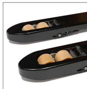
Прочные зауженные вилы