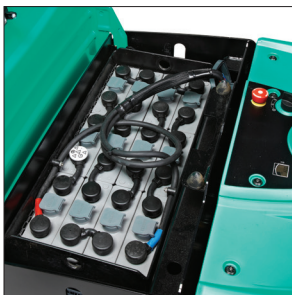
Аккумуляторы большой емкости