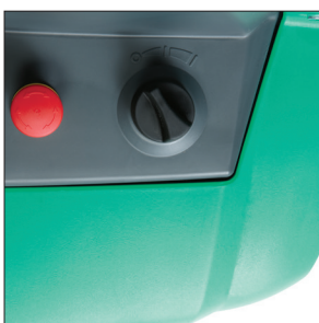
Выбор режима производительности