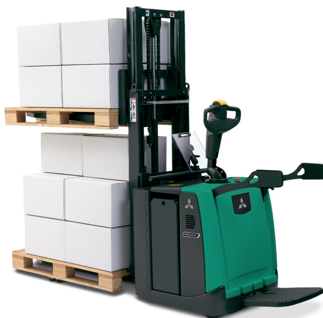
PREMIA EM • PBV20PD