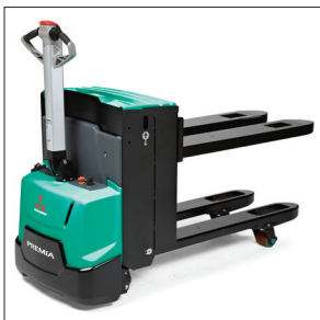
Подъемные вилы (PBP20N2E)