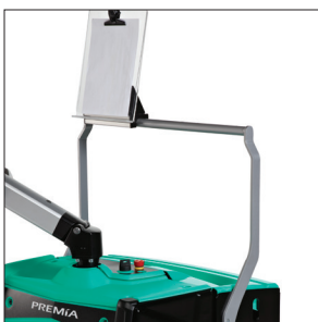
Уникальная конструкция перекладки