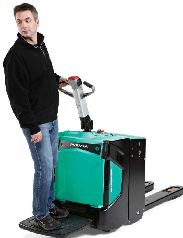
PREMIA ES • PBP20N2R