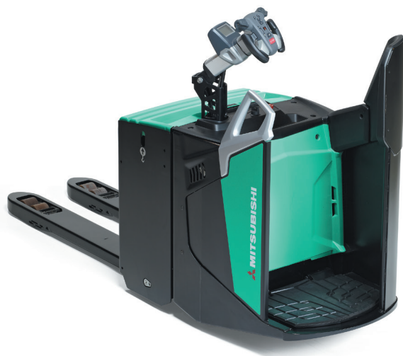
PREMIA ES • PBF25N2