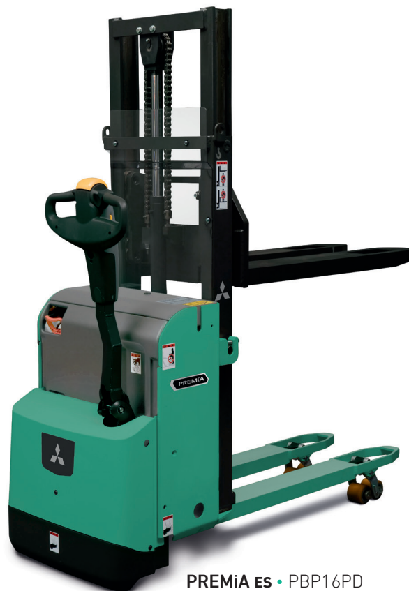
PREMIA ES • PBP16PD