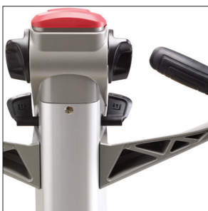
Современная рукоятка управления

Сопровождаемые и двойные перевозчики паллет 1.6 - 2.0 тонны