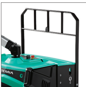
Защитная решетка груза (опция)

Сопровождаемые и двойные перевозчики паллет 2.0 – 2.5 тонны