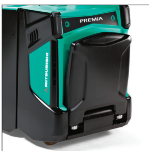
Складная платформа оператора (PBP20N2R)