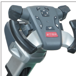
Рулевое колесо Maxius

PREMIA EM платформенные перевозчики паллет созданы для самых сложных условий работы.