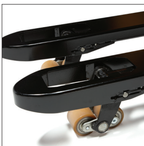
Ведущая на рынке высота подъема