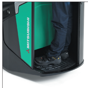
Большая подвесная платформа оператора