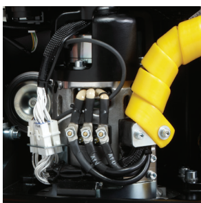
Литой силовой агрегат