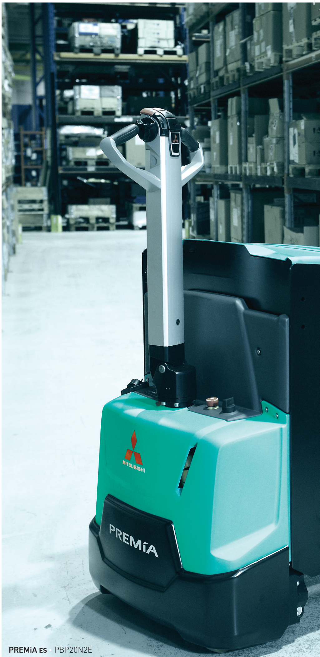
PREMiA ES · PBP20N2E

Продуманный дизайн и умные технологии позволяют отработать рабочую смену без стресса и с максимальной продуктивностью.